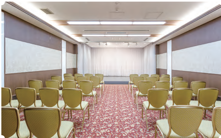
行華殿 1階式場 (松)