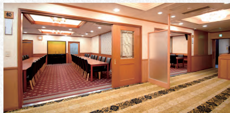
行華殿 2階お清め室 (松・竹)