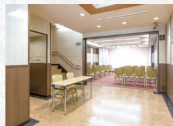
行華殿 1階ホール (松)

くつろぎの中にも品のある雰囲気的空間。 「松」と「竹」の同タイプ2つの式場をご用意 しております。