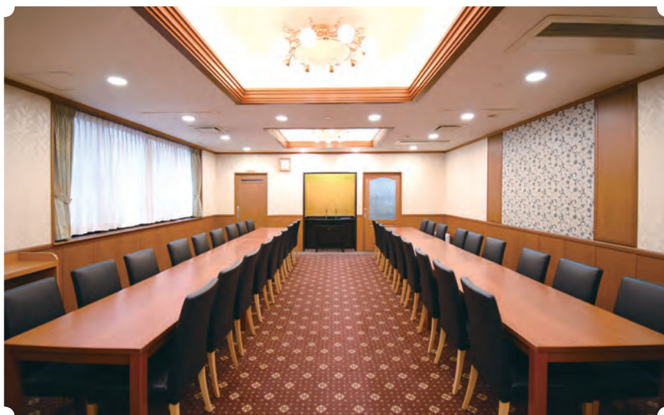
行華殿 2階お清め室 (松)